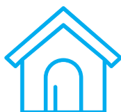
Mejora el confort de la edificación