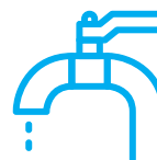
Lavarse con agua