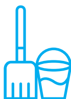
Limpiar bien la superficie