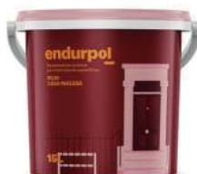
ROJO CASA INGLESA